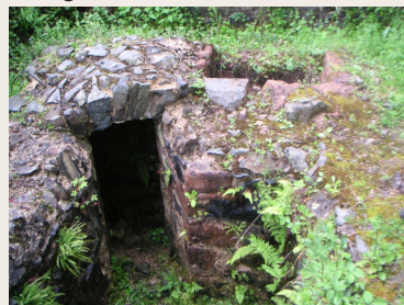
Entrée de l'une des mines de Pampailly

Actuellement, Charfetain est un manoir où l'on peut remarquer le portail d'entrée et la petite Chapelle. C'est un gîte rural.