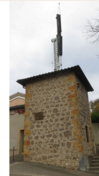
La tour de Ste Foy aujourd'hui