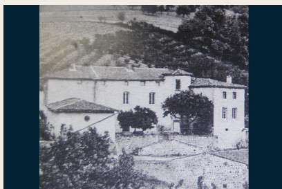
Le château de Charfetain